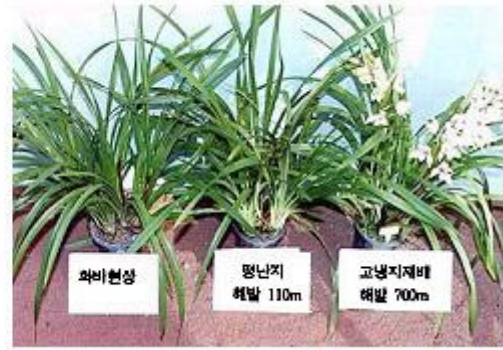
그림 2. 야간온도조건에 따른 개화기의 차이