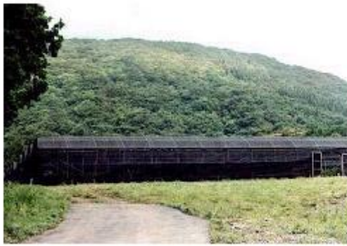
그림 1. 고온기의 야간온도를 낮추기 위하여 고냉지에서 35%의 차광 막재배

양란 심비디움의 리드벌브에서 액아가 화아분화되는 시기는 6월~9월경에 되는데 화아가 정상적으로 발달되는 야간온도는 10~15℃이며, 20℃ 이상에는 화아의 생장이 억제된다. 30℃ 이상에서는 화아고사와 Blasting 이 생긴다. 또 양란 심비디움의 정상적인 생육온도는 20~25℃이기 때문에 하계 고온기에 야간온도를 낮추는 것이 개화품질 및 개화시기를 단축시키는데 필수적이며 자연조건을 이용한 고냉지 재배와 축성재배용 품종으로 가능하게 되었다.