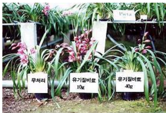
그림 4. 시비량에 따른 개화차이