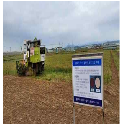
'올레찰' 기장 수확 현장