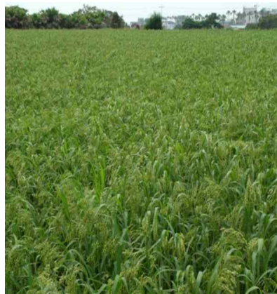
'올레찰' 기장 포장 전경