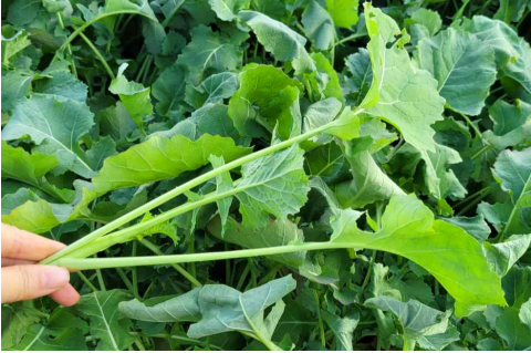
2021.1.2.(토) 제주시 외도동, 유채나물

겨울철 틈새 소득작목으로 재배 중인 나물용 겨울 유채는 수확 출하가 순차적으로 진행되고 있다. 경락가격(제주시농협농산물 공판장 1.4.)은 2,375원/kg으로 전 15일대비 1,381원 상승한 가격에서 형성되고 있으며, 전년(2020.1.6.) 455원 대비 5배 이상의 높은 가격을 보이고 있다.