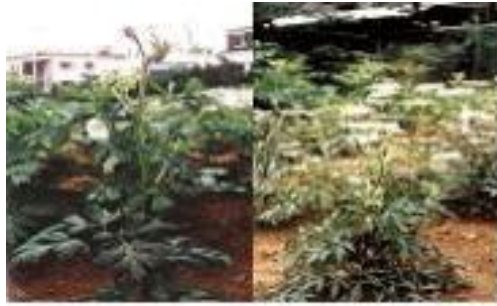
그림 2. 중국당귀, 일당귀