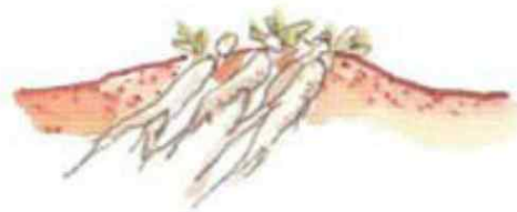
묘의 머리 부분 굵기가 0.3~0.7cm의 묘를 골라 심는다. 이보다 굵은 묘는 꽃대가 생기므로 피한다.