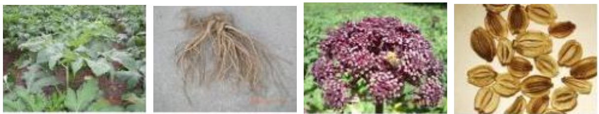
그림 1. 참당귀의 잎, 뿌리, 꽃, 종자 모양

참당귀는 산형과 초본으로 줄기는 암녹색~자주빛을 띠며, 굵기는 직경이 2.0~3.0cm, 키는 1.0~1.5m이다. 주 줄기 및 분지 끝에 복산형화서(復散形花序)로 작은 자색 꽃이 많이 모여서 핀다. 잎 모양은 우상복엽으로 2~3갈래로 갈라지고 갈라진 작은 잎은 긴타원형 또는 계란형이고 잎 가장자리는 톱니 모양이다. 과실은 분과(分果)로써 납작하고 둥근 모양으로 양쪽에는 날개가 있다. 종자 1,000알의 무게는 2.5~3g 정도이다. 주 뿌리의 길이는 10~15cm, 직경 2~5cm 이고 가지뿌리는 20~25cm 이다. 뿌리는 강한 향기를 갖고 있다.