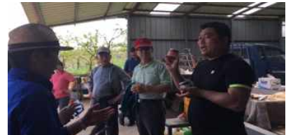
교육생농가 등 현장실습 및 컨설팅