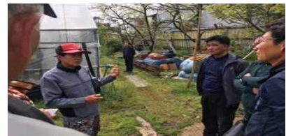
이론교육 및 토론